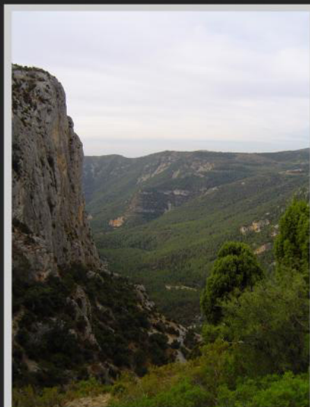
Vista de los meandros del "Riu Montlleó"

Ruta circular que sale de Culla por la Avenida San Cristóbal hacia el camino de Benafigos, en dirección al campo de fútbol. Una vez allí se toma el camino de la izquierda hacia el "Mas de les Barredes", luego se desvía a la derecha por una pista que sube al "Mas de la Xurumbela". Antes de llegar a la masía se deja una pista a la derecha y se continúa por la izquierda pasando por delante de la masía. La pista sigue bajando hasta que se encuentra con una portera, en éste punto se coge una senda a la derecha que un poco más abajo cruzará la misma pista. Se sigue bajando por un camino que primero va por el lado derecho del barranco de "Penyalva" y que luego lo cruza varias veces. El sendero transcurre entre el "Single Verd" y la "Roca de Penyalva". Desde esta zona, al otro lado del "Riu Montlleó", se ve la población de Benafigos.