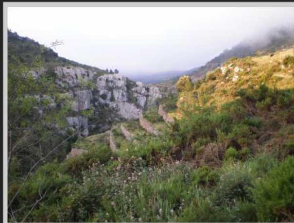
Vista del sendero

El sendero se toma saliendo de Culla por la avenida San Cristóbal, a unos cien metros se deja el camino desviándose a izquierda por un camino de tierra. Éste llevará tras un tramo de descenso a una pista, siguiéndola a derecha, según orientación de la marcha, llevara hasta la "Font d'en Cabrit". Sin necesidad de subir hasta la misma fuente, el sendero continua a izquierda, por el camino que desciende hacia la zona de acampada. Se cruza el barranco enlazando a derecha con una senda que, lleva a otra pista de tierra. Desde aquí continuando a derecha, y en el primer cruce a izquierda, se llega a una era en el "Mas de la Baseta", por el acceso a la masía se debe desviar a derecha por una senda que tras cruzar el barranco ira ladeando el montículo, pasando por debajo de la "Roca del Corb" donde se encuentran numerosos hipogeos