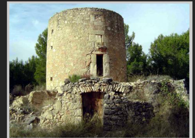
Molino de Viento